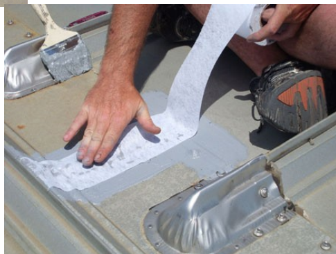
Polycore ポリコア ポリエステル 100%補強布

ToppsSealの性能を最大限に引き出す関連資材としてご活用ください。使用方法、他詳細についてはお問い合わせください。