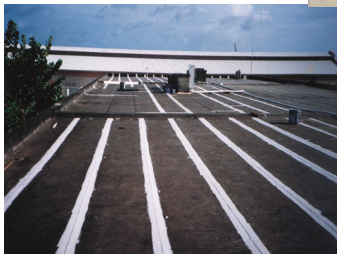
Polyprene ポリプレン・塩ビシート用

Polypreneはオールラバーで繊維を多く配合した下地補修のオールランドプレイヤー材です。柔軟性のある補強材として伸長率もToppsSeal900%に対して850%と相性も抜群。補強布のPolycoreと組み合わせれば、多方向への強度が確保できます。