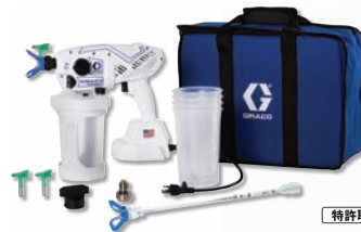
特許取得済みの技術