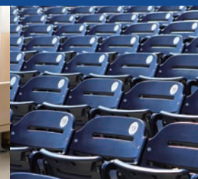
競技場と競技施設