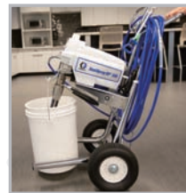
特許取得済みの技術