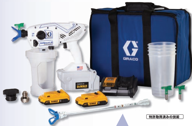
特許取得済みの技術